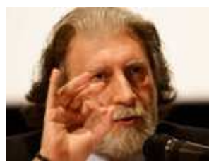
Roberto Scarpinato

Das Angebot an Arbeitskraft ist exponentiell angestiegen, wodurch die Preise auf dem legalen Arbeitsmarkt gefallen sind. Das schwächt die Verhandlungsposition der Arbeiterklasse und Mittelschicht in den westlichen Ländern. Die Konzerne bedienen sich natürlich gerne der neuen billigen Arbeitskräfte. Um Kosten zu sparen, verlegen sie die Produktion ins Ausland (Offshoring) oder übertragen sie an andere Firmen (Outsourcing). Jetzt bekommen Arbeiter in den Westländern plötzlich niedrigere Löhne, müssen mehr arbeiten und sich mit Zeitarbeit arrangieren und dürfen dann hoffen, dass die Betriebe ihre Produktion nicht in Länder verlagern, wo Arbeitskräfte billiger sind, weil dort keine gesetzlichen Regelungen existieren, die Mindestlöhne garantieren und die Rechte von Arbeitern schützen.